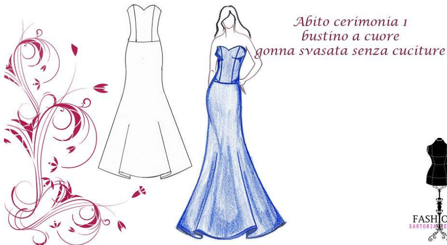
Abito cerimonia 1 bustino a cuore gonna svasata senza cuciture

Su molte vostre richieste ho separato dal corso, il modello del abito da cerimonia con bustino steccato, e gonna a sirena senza cuciture - come creare cartamodello, segreti per creare cartamodello del bustino steccato .