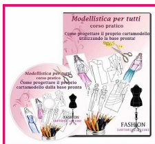
Modellistica per tutti